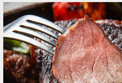
Quasi de veau Lou Beteth Label rouge