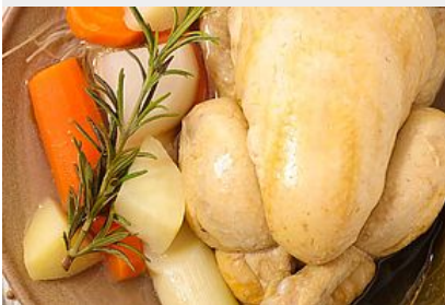
Terrine de Poule au pot