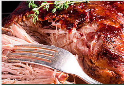
Effiloché d'échine de porc noir confite