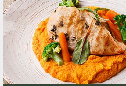
Suprême de Poulet du Gers Poché et Laqué