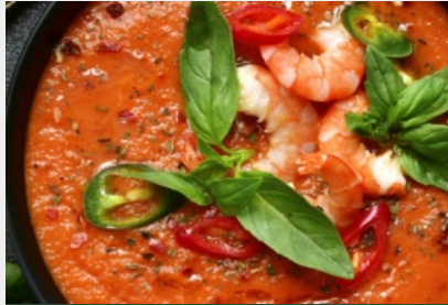
Crème Froide de Tomate, Julienne de Jambon sec Grillé et Huile de Gambas