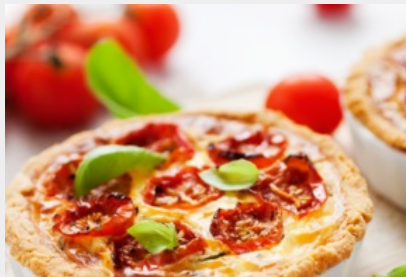
Tartelette aux Tomates Cerises, Mousse de Mozzarella Infusée au Thym