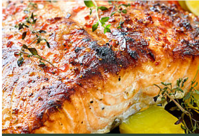
Dos de Saumon Cuit sur la Peau