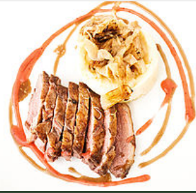
Magret de canard du Gers rôti