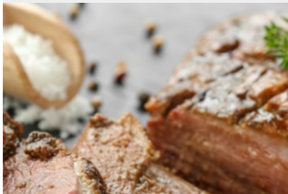
Magret de Canard du Gers Rôti en Croûte d'Herbes