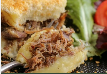
Parmentier de Canard au Vin Rouge