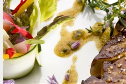
Foie Gras chaud et sa « croûte » au Chorizo et petits condiments