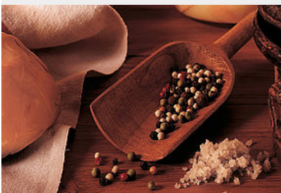
Pressé de foie gras de canard du Gers mi-cuit