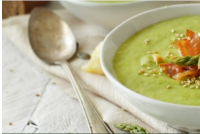
Crème d'Asperges Vertes, Chips de Lard, Huile d'Olive