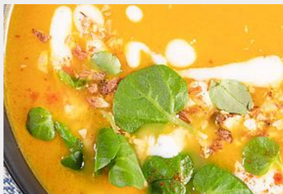
Crèmeux de Courges bio du Gers