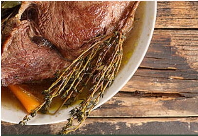
Pot au feu de boeuf « race mirandaise »