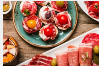
Assortiment de tapas